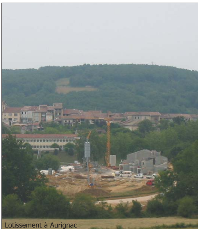
Lotissement à Aurignac

Saint-André aussi, propose trois terrains constructibles tout en étudiant la réhabilitation de l'ancienne grange pour la réalisation éventuelle de logements.