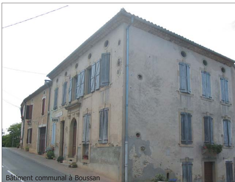
Bâtiment communal à Boussan

gement inexistant sur le canton et qui pourrait s'avérer des plus utiles.