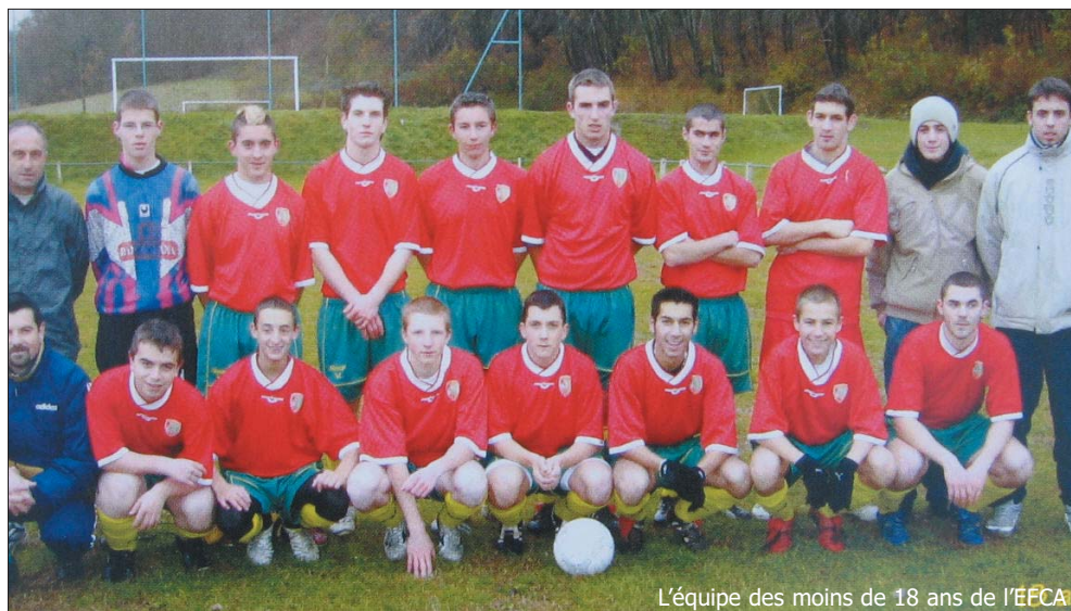
L'équipe des moins de 18 ans de l'EFCA

Aujourd'hui on mesure avec satisfaction le bien fondé de cette fusion d'autant que pour une première saison les résultats sportifs vont au delà de ce que tout le monde espérait. Avec ses quatre équipes l'EFCA évolue sur les stades d'Aurignac, de Boussan et d'Aulon, village qui dispose de belles installations et qui retrouve le football après plusieurs saisons de manque.