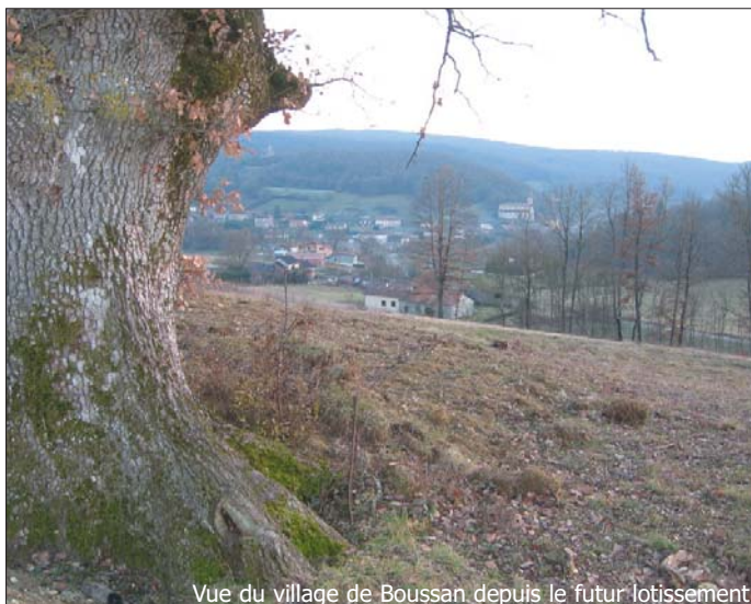
Vue du village de Boussan depuis le futur lotissement

sement la commune s'est lancée dans une urbanisation raisonnée pour dégager quelques terrains à bâtir. Ainsi sur une grande parcelle qui surplombe le village dix lots ont été aménagés et viabilisés. Aujourd'hui ces terrains sont mis à la vente à un prix (entre 6 et 10 € le m 2 ) qui reste encore dans la limite du raisonnable.