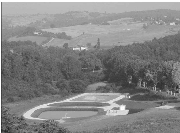
la station de lagunage est opérationnelle pour traiter les premiers effluents

Ces eaux traitées, conformément à la réglementation, peuvent donc être déversées dans le milieu hydraulique superficiel, à savoir le ruisseau de Rhodes qui accueillait jusque là des effluents bruts. Cette station d'épuration va monter en régime progressivement, et en fin d'année elle devrait recevoir les eaux usées de 300 habitants.