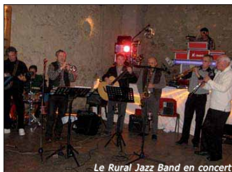
Le Rural Jazz Band en concert

l'enceinte du festival s'élèvera à 5 € pour participation aux frais et il sera possible de restaurer sur place.