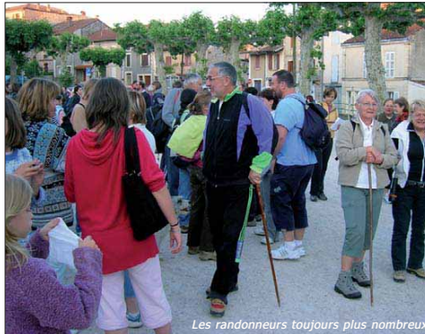
Les randonneurs toujours plus nombreux

- vendredi 27 juillet : le concert 31 notes d'été offert par le conseil général 31, musique africaine avec le groupe Togo Tempo (clôturé par un feu d'artifice du Château), - samedi 11 août : le challenge sportif de la piscine, - mardi 14 août : la soirée du cinéma en plein air, - samedi 17 novembre : le spectacle Pronomade(s) offert par la communauté de communes du canton d'Aurignac, à la salle du gymnase d'Aurignac. La compagnie Baro d'Evel Cirq Cie se produira pour un spectacle de cirque contemporain (technique du clown et de l'acrobate).