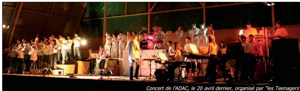
Concert de l'ADAC, le 20 avril dernier, organisé par "les Teenagers"

canton, la communauté de communes a mis une salle à leur disposition dans ses locaux, tout en leur octroyant une subvention de 1000 € abondée par la Mutualité Sociale Agricole, à hauteur de 2000 €.