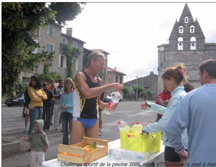
Challenge sportif de la piscine 2006, relais VTT / course à pied à Alan

Quant au challenge sportif de la piscine 2007, nageurs, vététistes et coureurs se retrouveront le samedi 11 août pour une compétition individuelle ou par équipe.