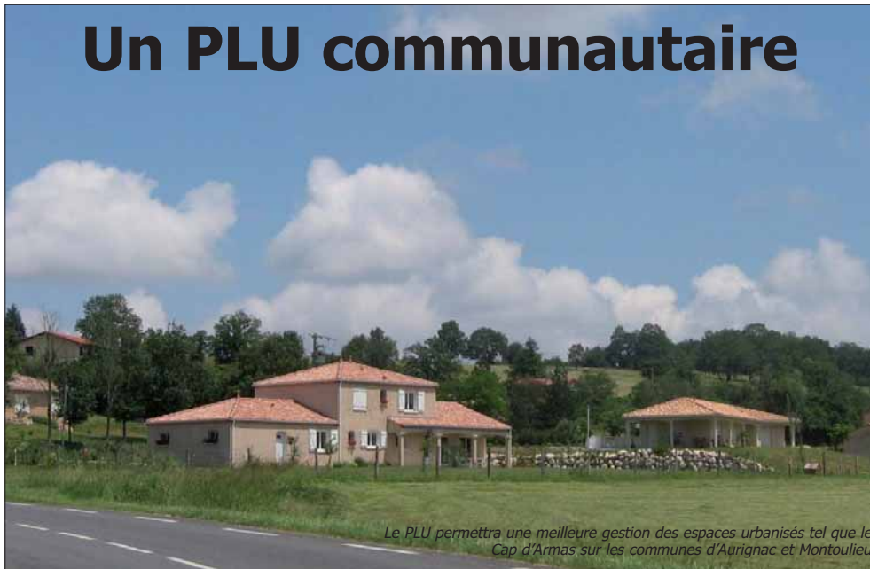
Le PLU permettra une meilleure gestion des espaces urbanisés tel que le Cap d'Armas sur les communes d'Aurignac et Montoulieu

L'une des innovations de l'année fut la décision par la communauté de communes du canton d'Aurignac d'élaborer un plan local d'urbanisme communautaire (PLU)