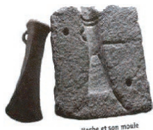
Hache et son moule

Du feu à la fonderie : bronze, hache et visite du beau village gaulois de Saint-Julien