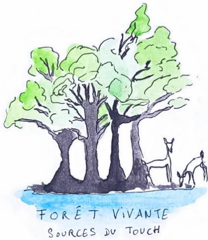
Illustration Philomène M.